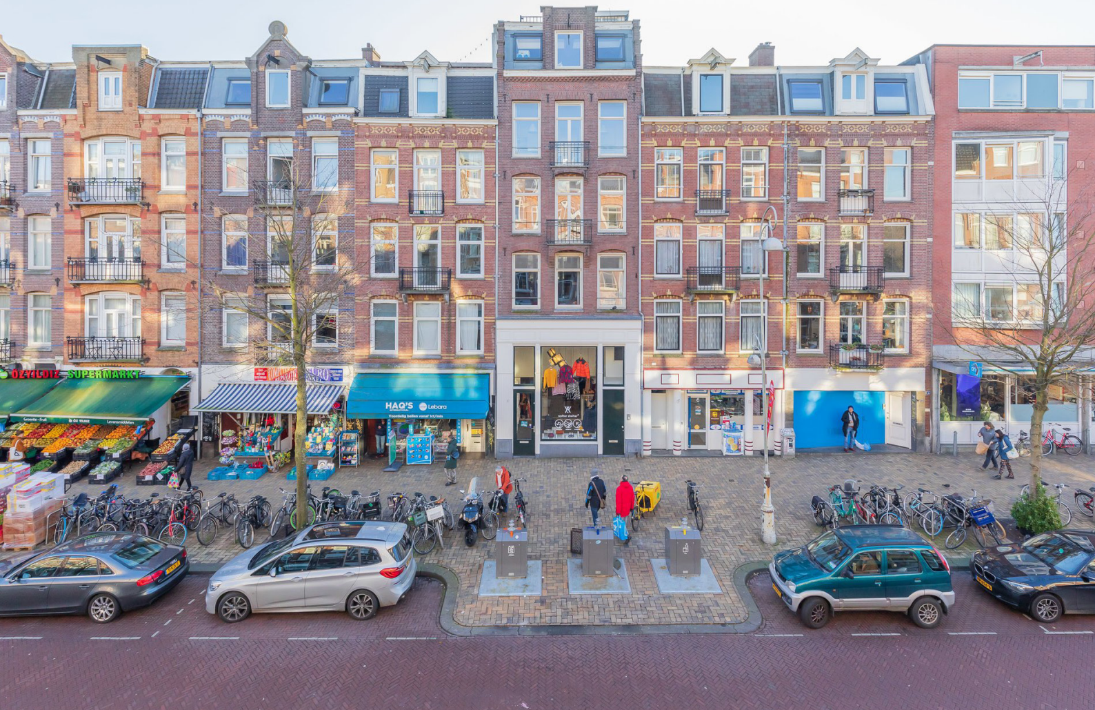
Javastraat 8 III, Amsterdam