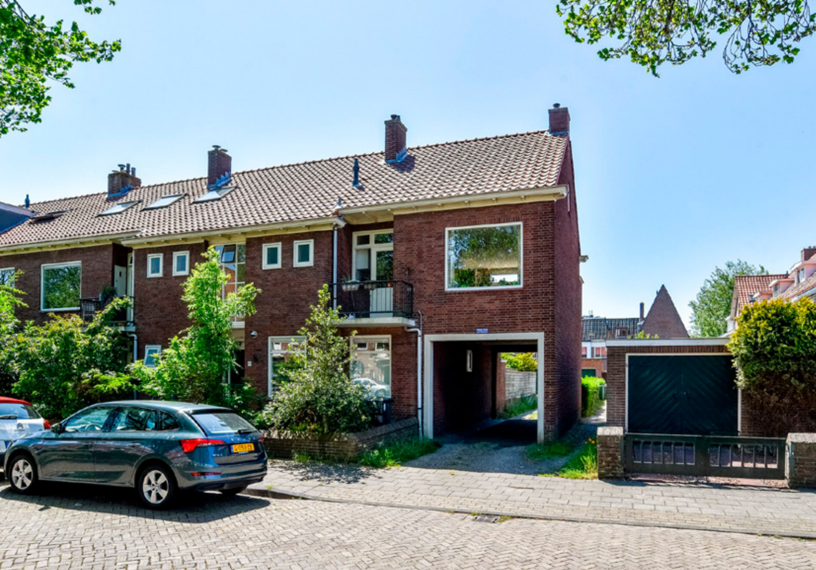
Amperelaan 16 I, Haarlem