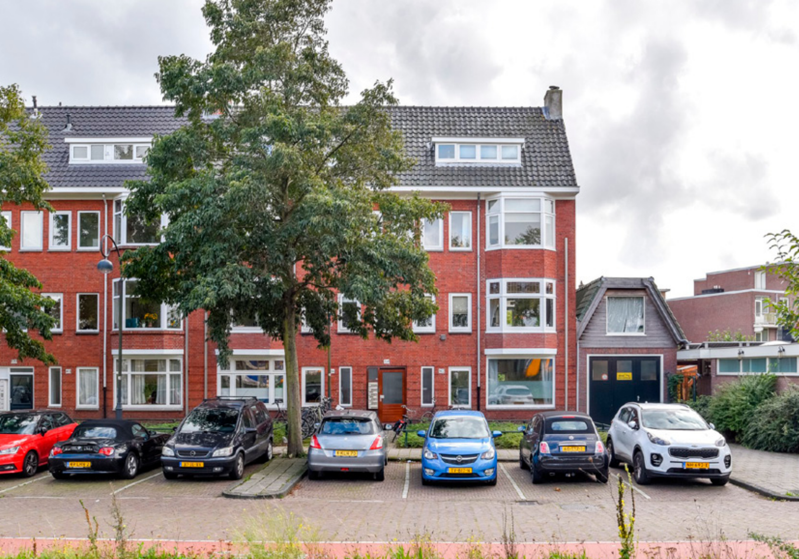
Amsterdamsevaart 164 A, Haarlem