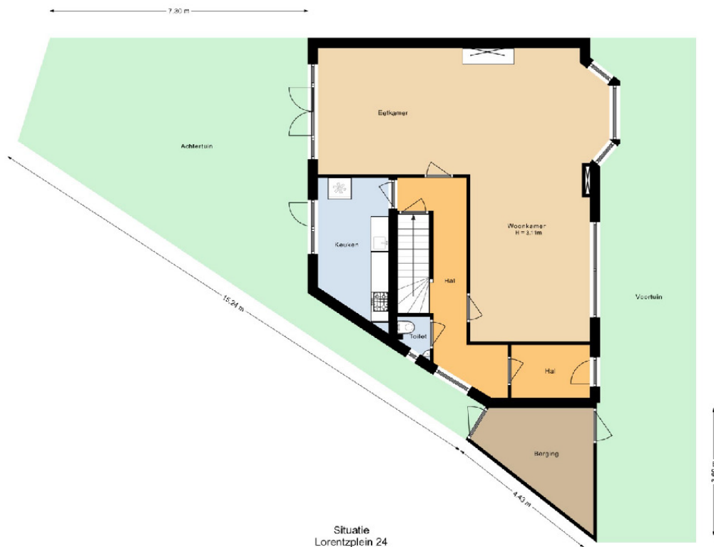
Situatie Lorentzplein 24 Haarlem