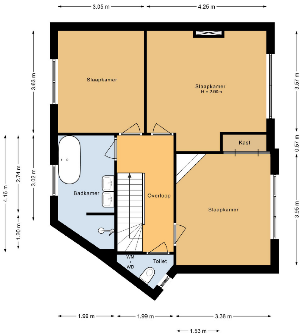
Eerste verdieping Lorentzplein 24 Haarlem