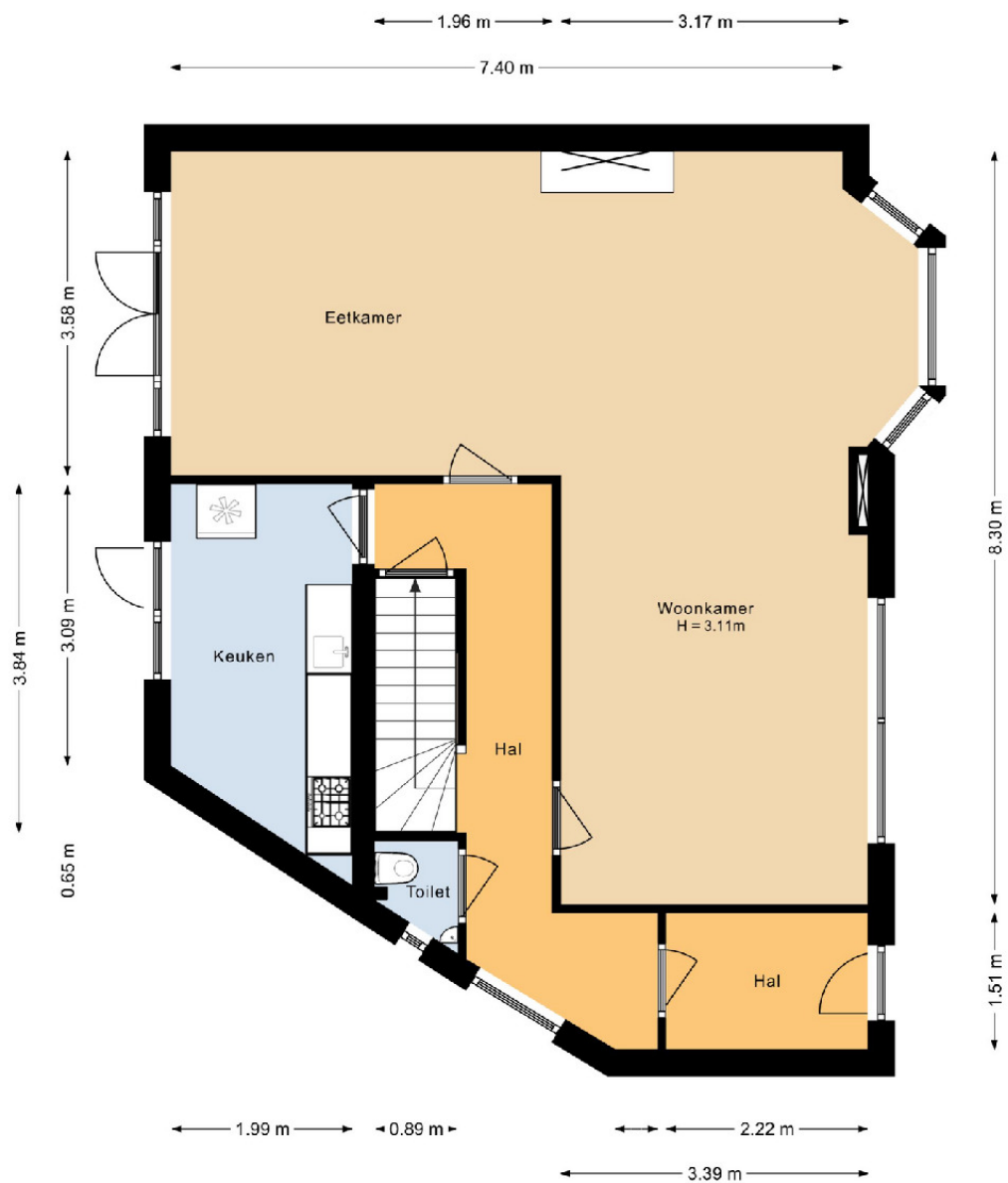
Begane grond Lorentzplein 24 Haarlem