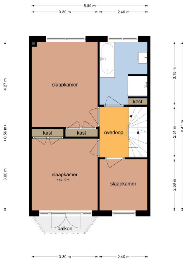
Overtonstraat 16 - Haarlem Eerste Verdieping

De plattegronden zijn geproduceerd voor promotionele doeleinden en ter indicatie. Aan de plattegronden kunnen geen rechten worden ontleend. © www.objectenco.nl