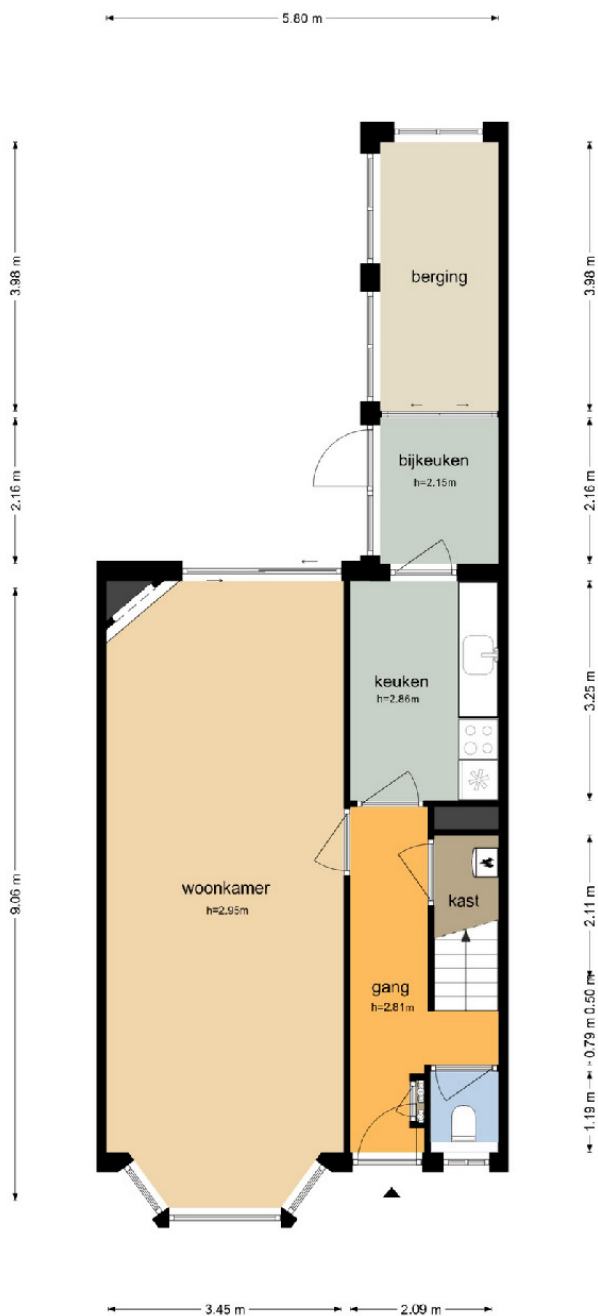
Overtonstraat 16 - Haarlem Begane Grond

De plattegronden zijn geproduceerd voor promotionele doeleinden en ter indicatie. Aan de plattegronden kunnen geen rechten worden ontleend.