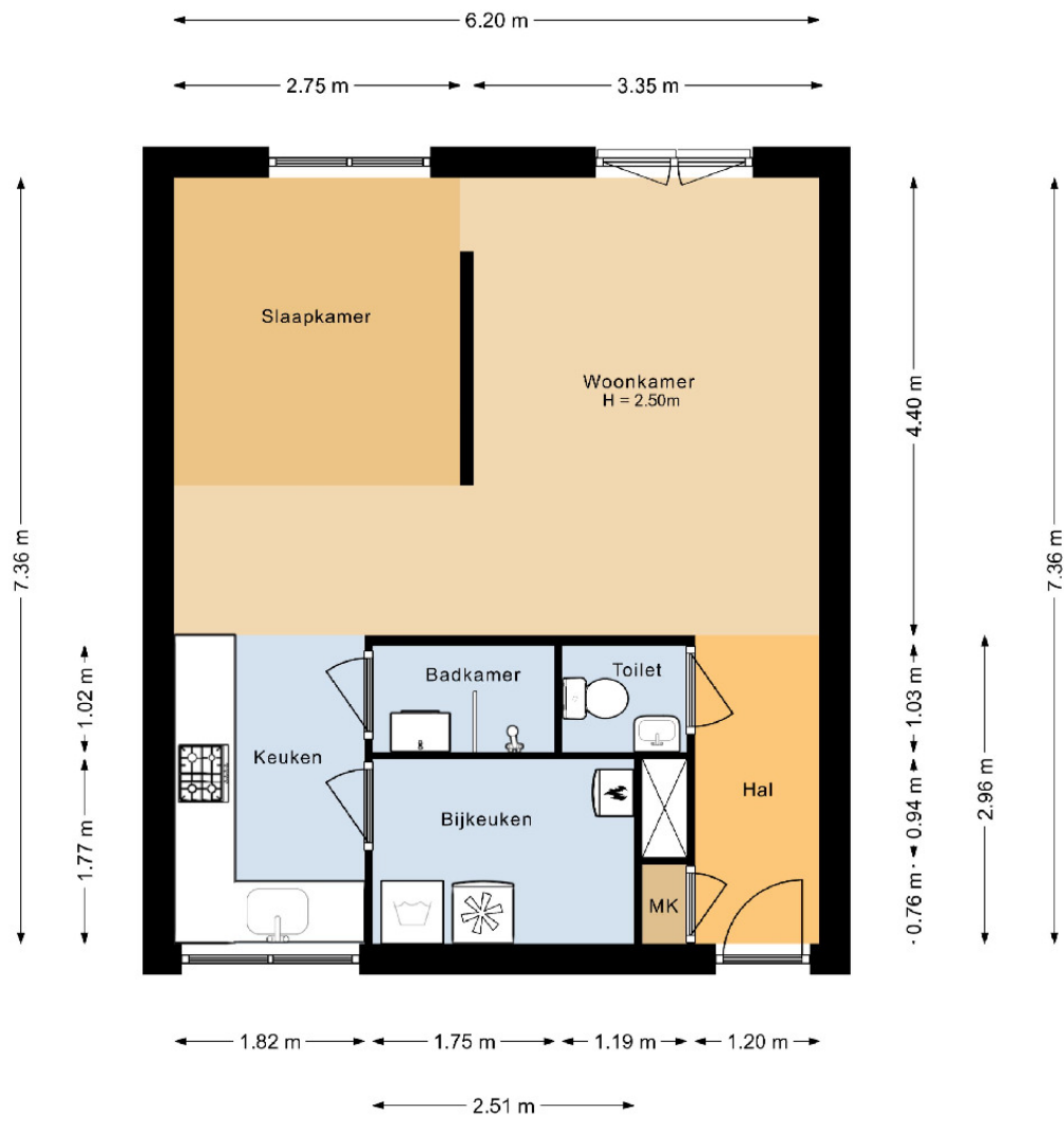
Appartement Osdorper Ban 90a27 Amsterdam