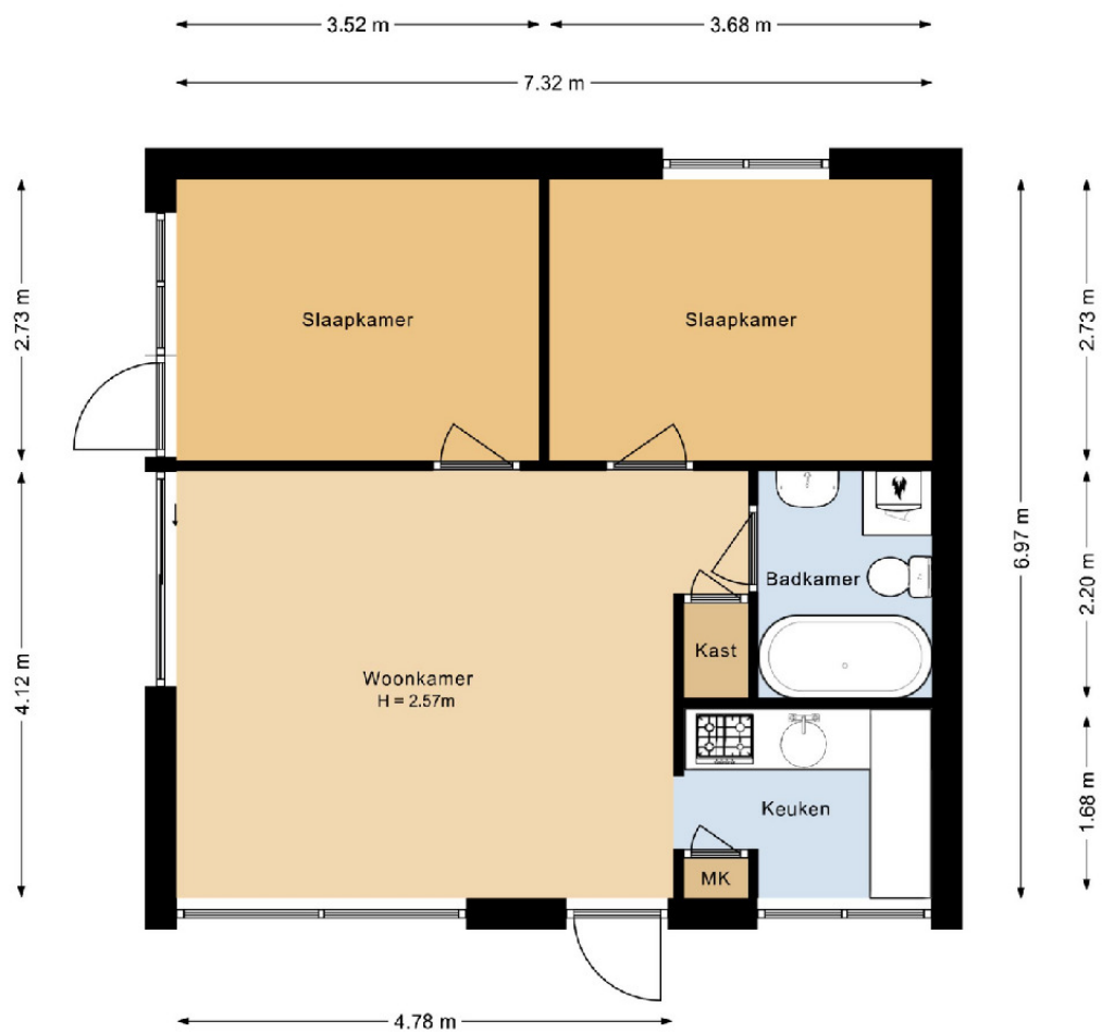
Recreatiewoning Duinschooten 12-166 Noordwijkerhout